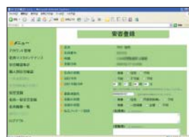
安否確認システム

この一環として、万が一の事態が発生した際、従業員の安否状況を家族や会社が確認できる「安否確認システム」を導入したり、全国各地の事務所において災害時に使用できる食料・飲料水・医薬品・毛布