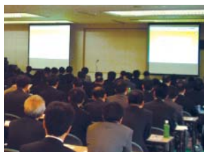
メンタルヘルス対策講義の様子

近年、社会問題となっているメンタルヘルスの対策について、年度昇格者向け職位別研修プログラムに盛り込み実施しています。