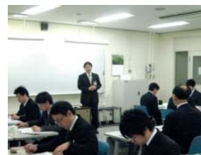
パートナー会社向けマナー指導員養成研修

ます。2008年度も、パートナー会社の管理者向けに「マナー指導員養成研修」を引き続き開催し、14社14名の方に参加いただきました。受講対象パートナーの拡大と研修を継続して行い、CS向上とCSRの共有化に努めています。